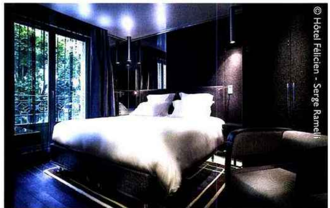
© Hôtel Félicien - Serge Ramelli