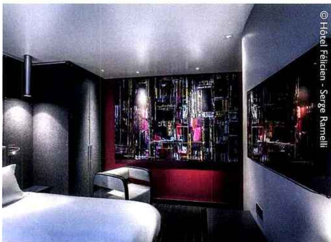
© Hôtel Félicien - Serge Ramelli

www.hotelfelicienparis.com , www.creationolivialapidus.com